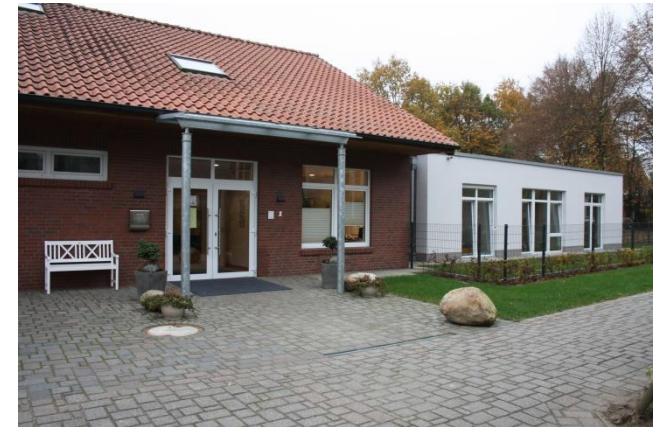
KiTa St. Gertrudis

Träger ist die kath. Kirchengemeinde St. Gertrudis