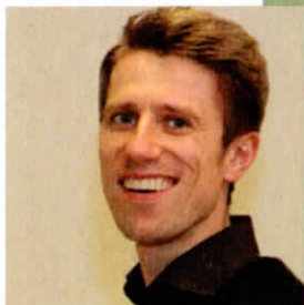
Organist Balthasar Baumgartner

Komponisten haben sich seit jeher von Klängen aus der Natur beeinflussen und inspirieren lassen. Insbesondere der Gesang der Vögel veranlasste eine ganze Reihe von Tonschöpfern zu einzigartigen Werken, die teils auch eigens für die Liturgie geschrieben wurden.