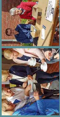
Das Pfarrfest lud wieder ein, an der Losaktion (siehe linkes Foto) oder an der Schätzaktion vom Pfarrgemeinderat teilzunehmen (siehe rechts)

Ein großer Dank geht an alle, die sich für dieses Fest eingesetzt und ihre Zeit und Mühe investiert haben.