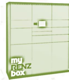
Packstation im Haus